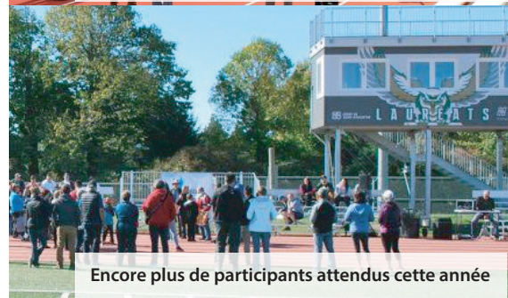
Encore plus de participants attendus cette année