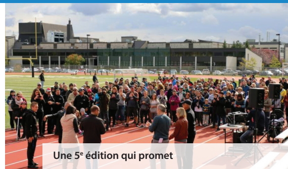
Une 5 e édition qui promet

Pour connaître tous les détails de l'événement, consultez le site Internet de l'Association ou restez à l'affût de la page Facebook.